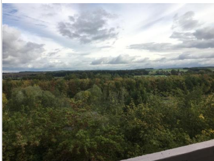
Ausblick vom Balkon