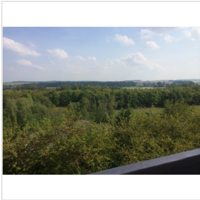
Blick ins Grüne

Zwickau Stadtteil Mosel, Nähe VW-Werk ruhige und grüne Lagel